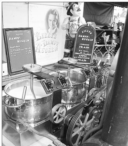
Rühren mit Dampf: Origineller Mixer